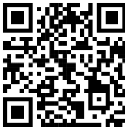
Диктант № 2