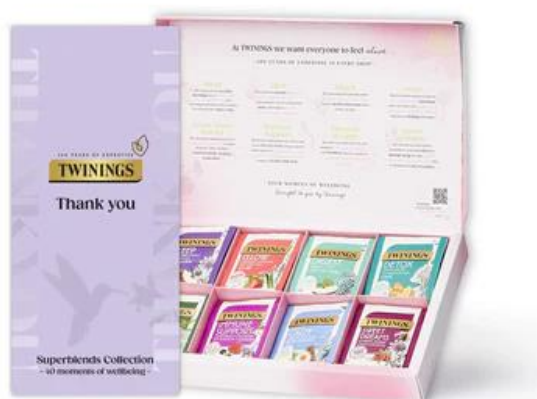
Рис.2.2 Упаковка Twinings