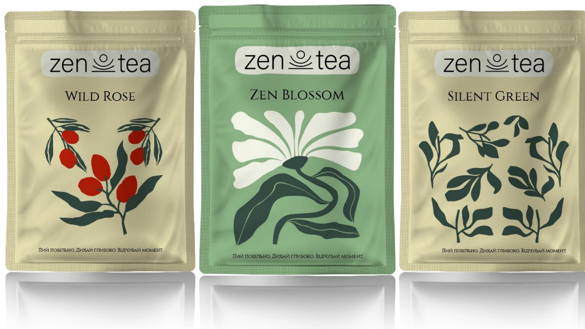
Рис.3.3: Різновиди упаковок чаю