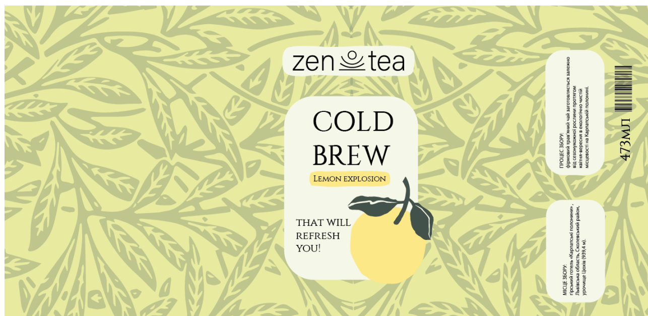
Рис.3.4 Розробка етикетки