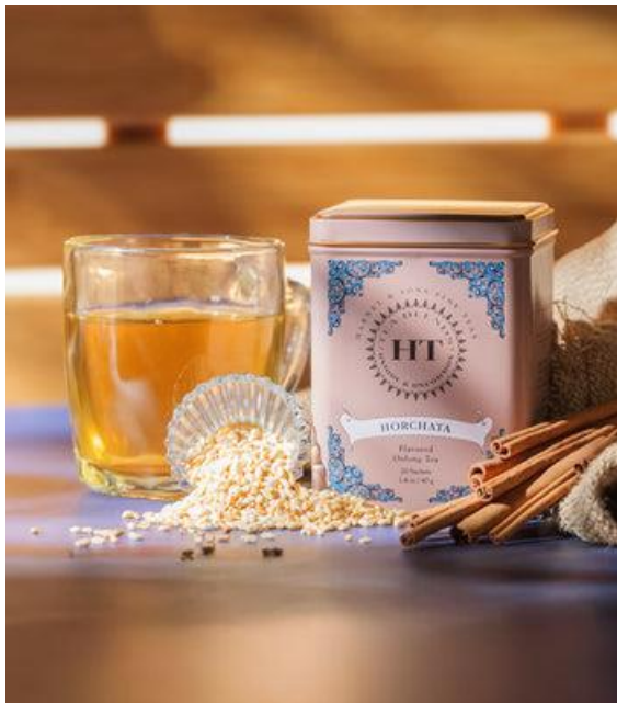
Рис.2.4 Упаковка Harney &amp; Sons.