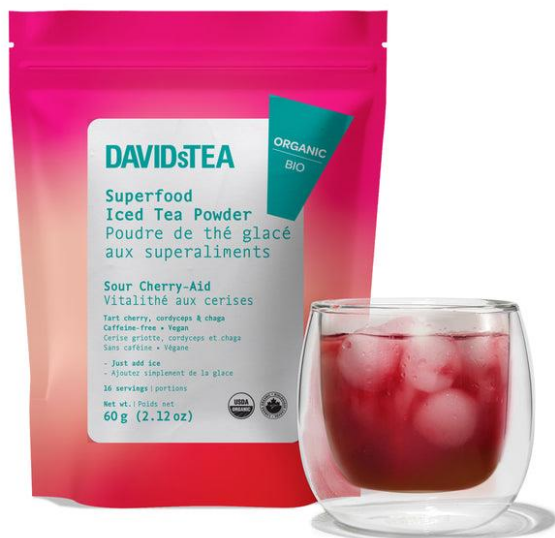
Рис.2.6 Упаковка DAVIDsTEA.