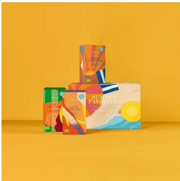
Рис.2.1 Упаковка Paper &amp; Tea