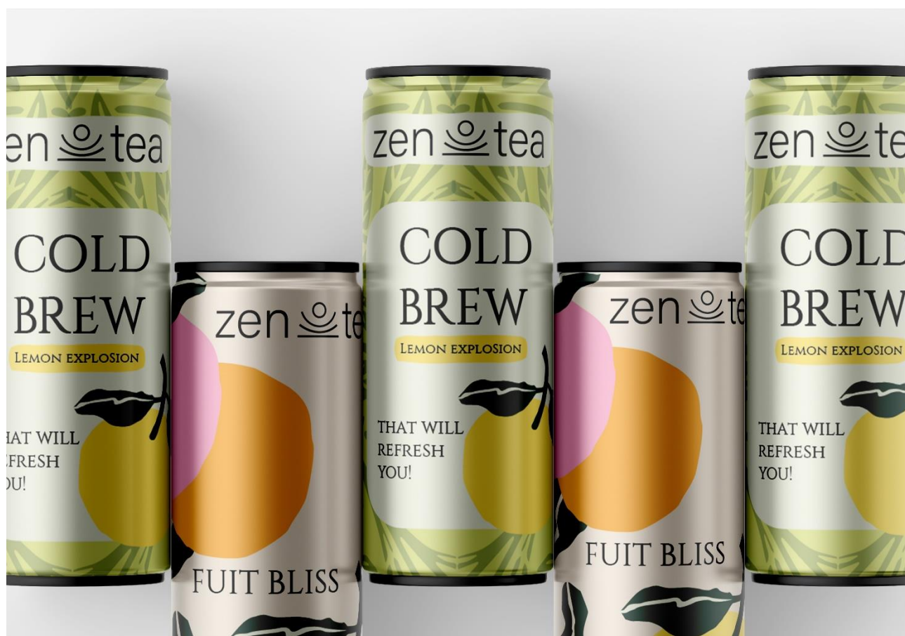
Рис. 3.2 Різновиди холодного чаю