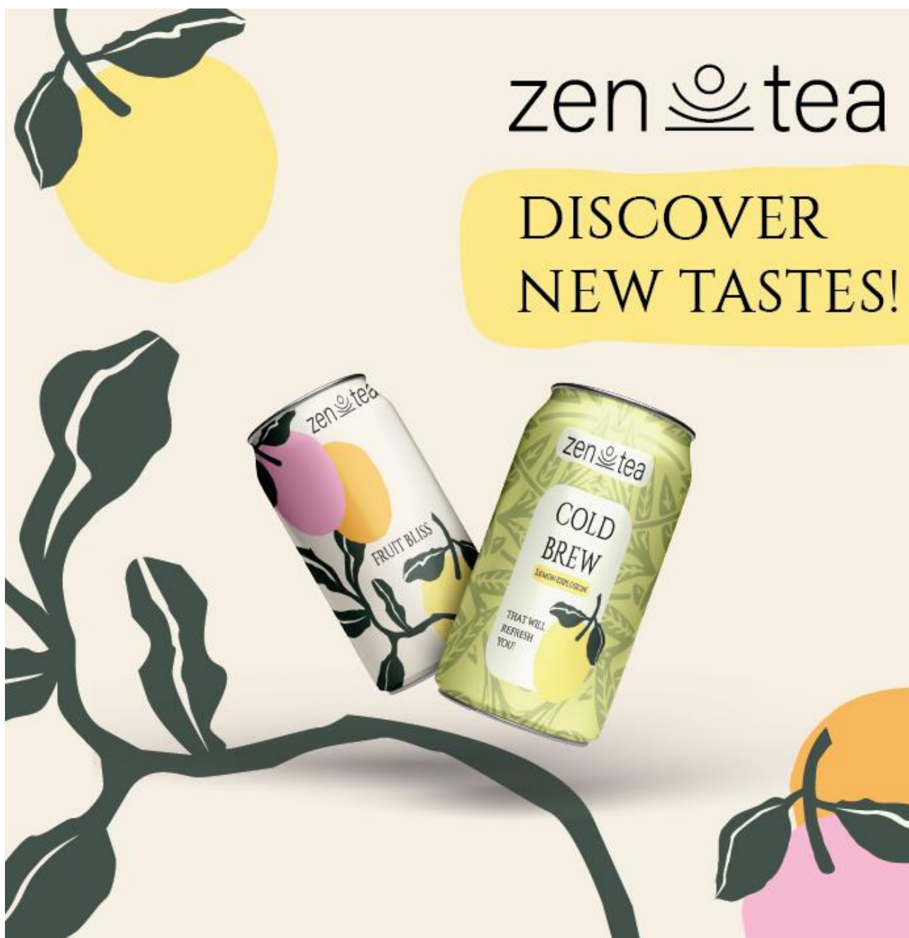
Рис.3.5 Розробка інтернет реклами