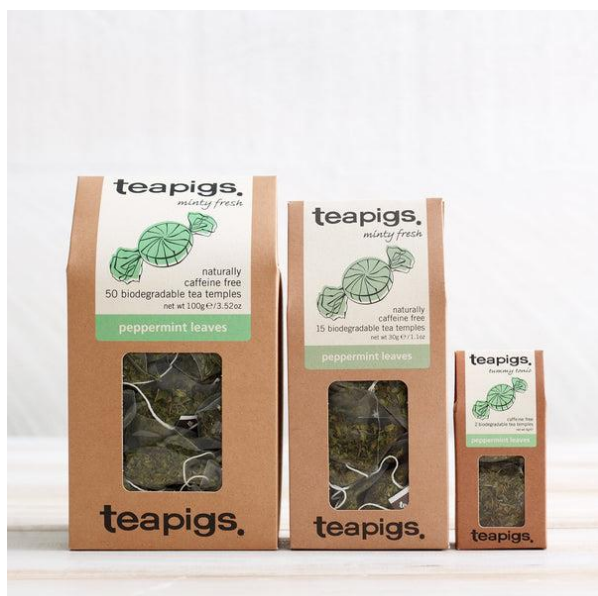
Рис.2.3 Упаковка Teapigs.