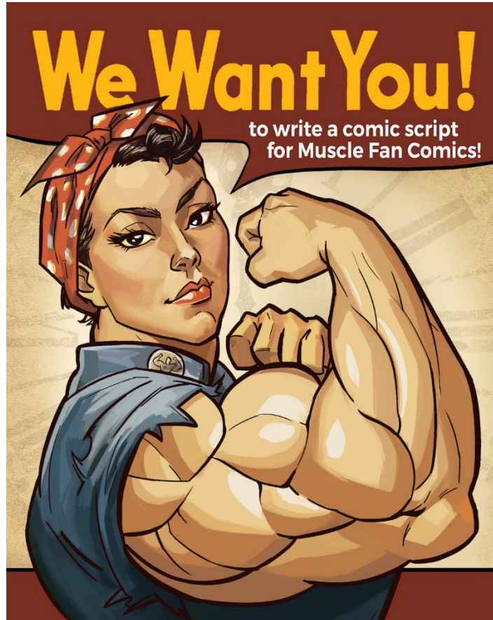
Рис. 2.2. «We Can Do It!»

Жест зігнутого біцепса символізує силу згуртованість і готовність діяти цей плакат використовується для залучення жінок до волонтерських і соціальних ініціатив у всьому світі.