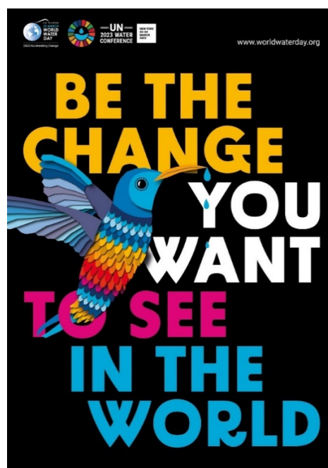
Рис. 2.5. « Be the Change »

3. Мотиваційні плакати – вони створені для того, щоб надихати людей на волонтерство через сильні емоційні образи та потужні послугу. Вони