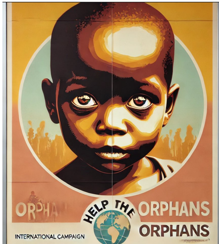
Рис. 2.6. « Help the Orphans »

Очі дитини символізують невинність і потребу в допомозі. М'які кольори та мінімалістичний стиль дизайну сприяють емоційній залученості.