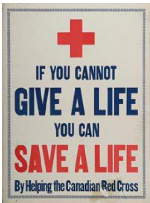
Рис. 2.4. « Your Help Can Save Lives »

Червоний хрест як центральний елемент миттєво асоціюється з допомогою та волонтерством. Простий дизайн без зайвих деталей підкреслює важливість послугу.