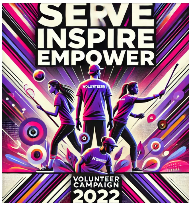
Рис. 2.7. « Serve, Inspire, Empower »

Ключові слова служіння натхнення розвиток відображають основні цінності волонтерської діяльності.