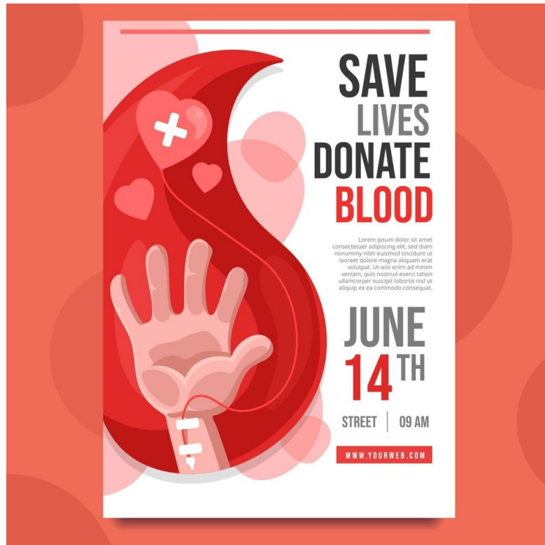
Рис. 2.1. Плакат « Give Blood, Save a Life »