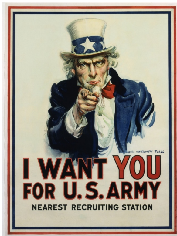
Рис. 2.3. « I Want You for U.S. Army »

Вказівний палець символізує прямий заклик до дії серйозний вираз обличчя додає авторитетності та важливості повідомлення.