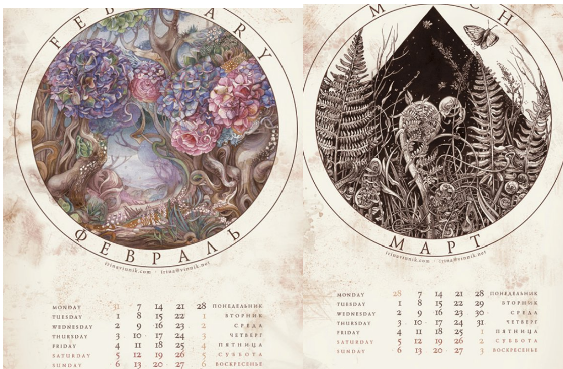
Рис. 2 Календар фантастичний [10].