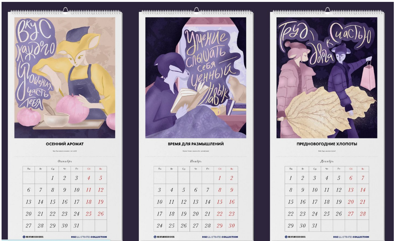
Рис. 9 Календар з тваринами [17]