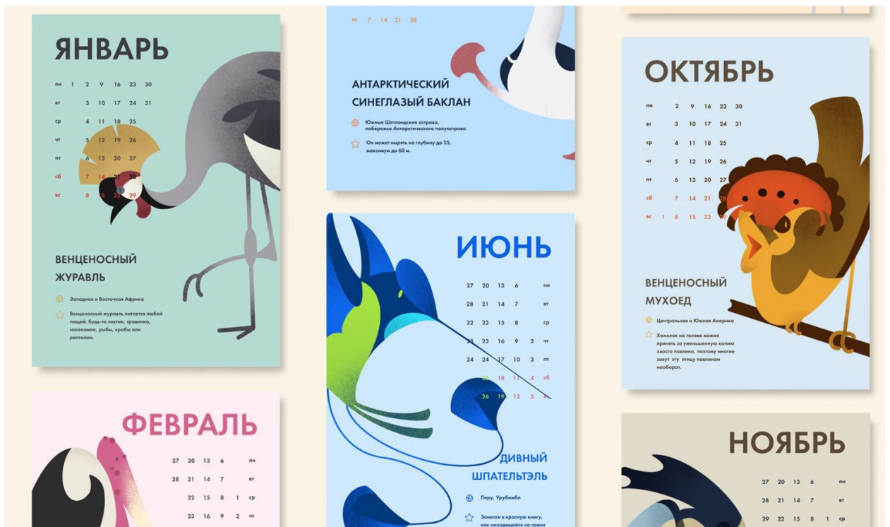
Рис. 10 Календар з пташками [18]