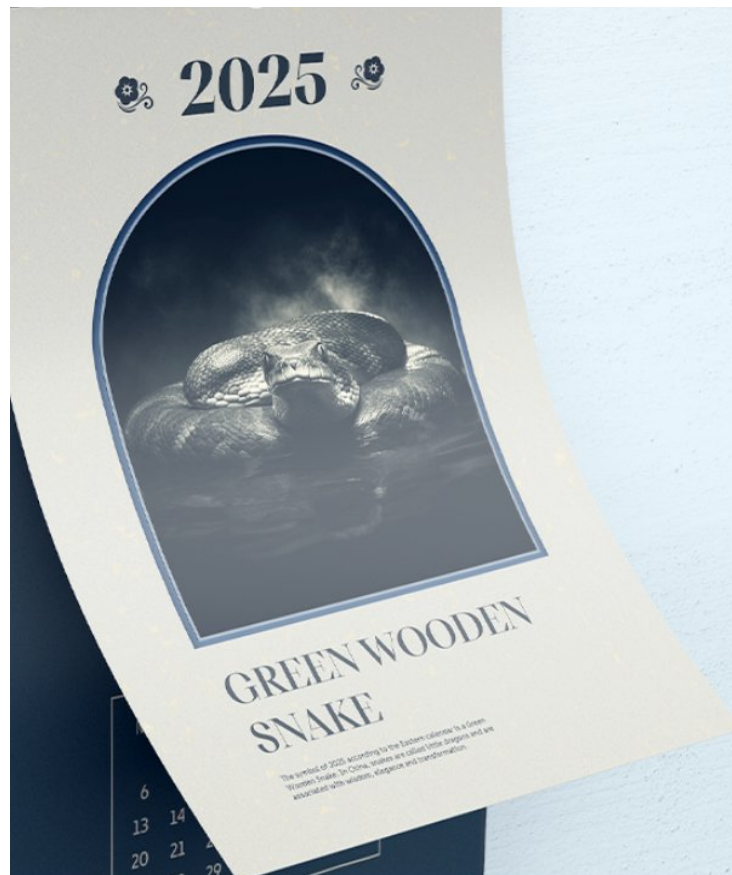
Рис. 4 Календар змя [12].