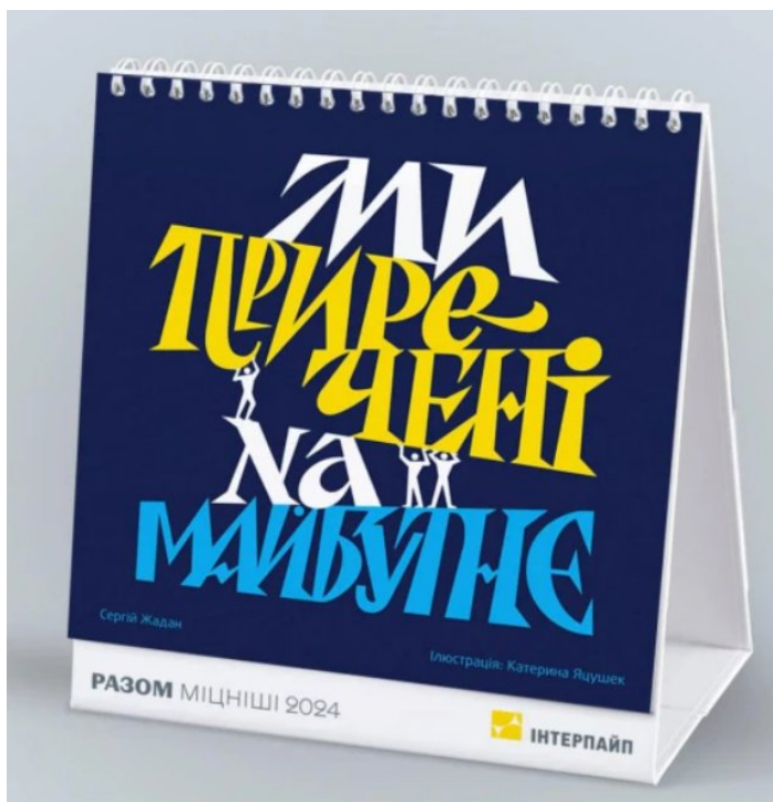
Рис. 1 Дванадцять цитат [9].