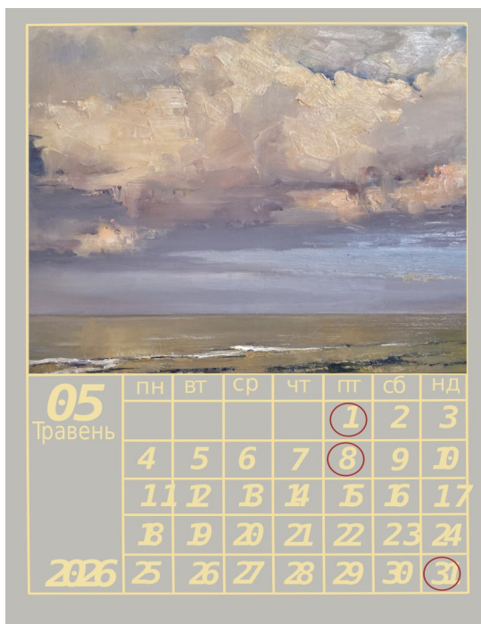
Розробка першого ескізу календаря