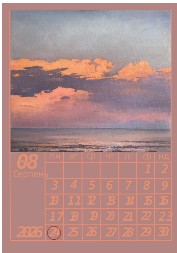
Розробка першого ескізу календаря