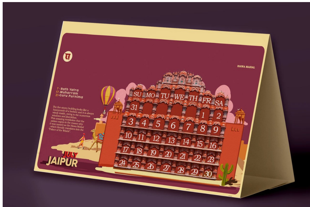
Рис. 6 Настільний календар [14]