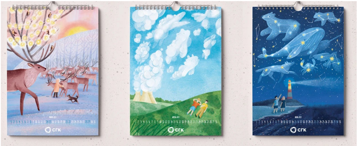
Рис. 7 Природній календар [15]