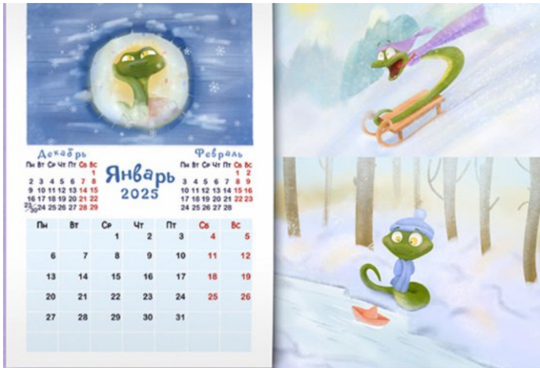
Рис. 5 Календар рік змії [13]