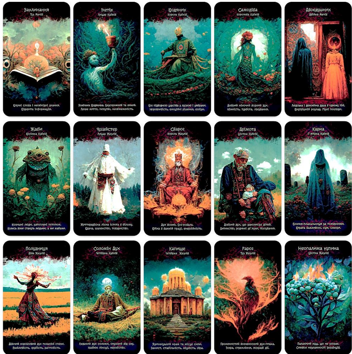
Рис. 1 «Таро Містичної Оріани» приклади карт