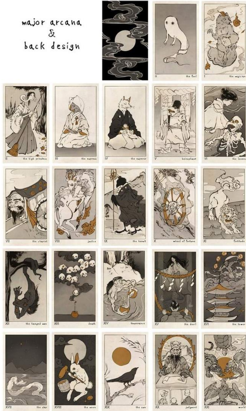
Рис. 2 «Yokai Tarot» приклади карт