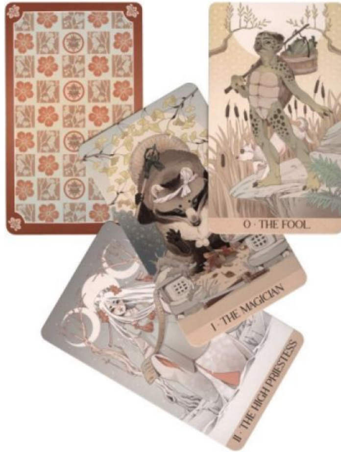
Рис. 3 «Yokai Tarot» сорочка і старші аркани