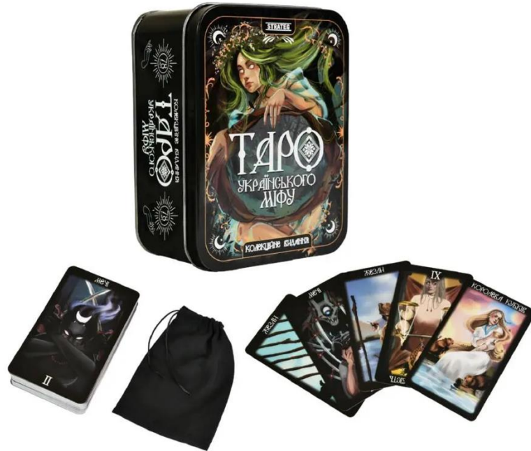
Рис. 4 «Таро Українського міфу» упакування