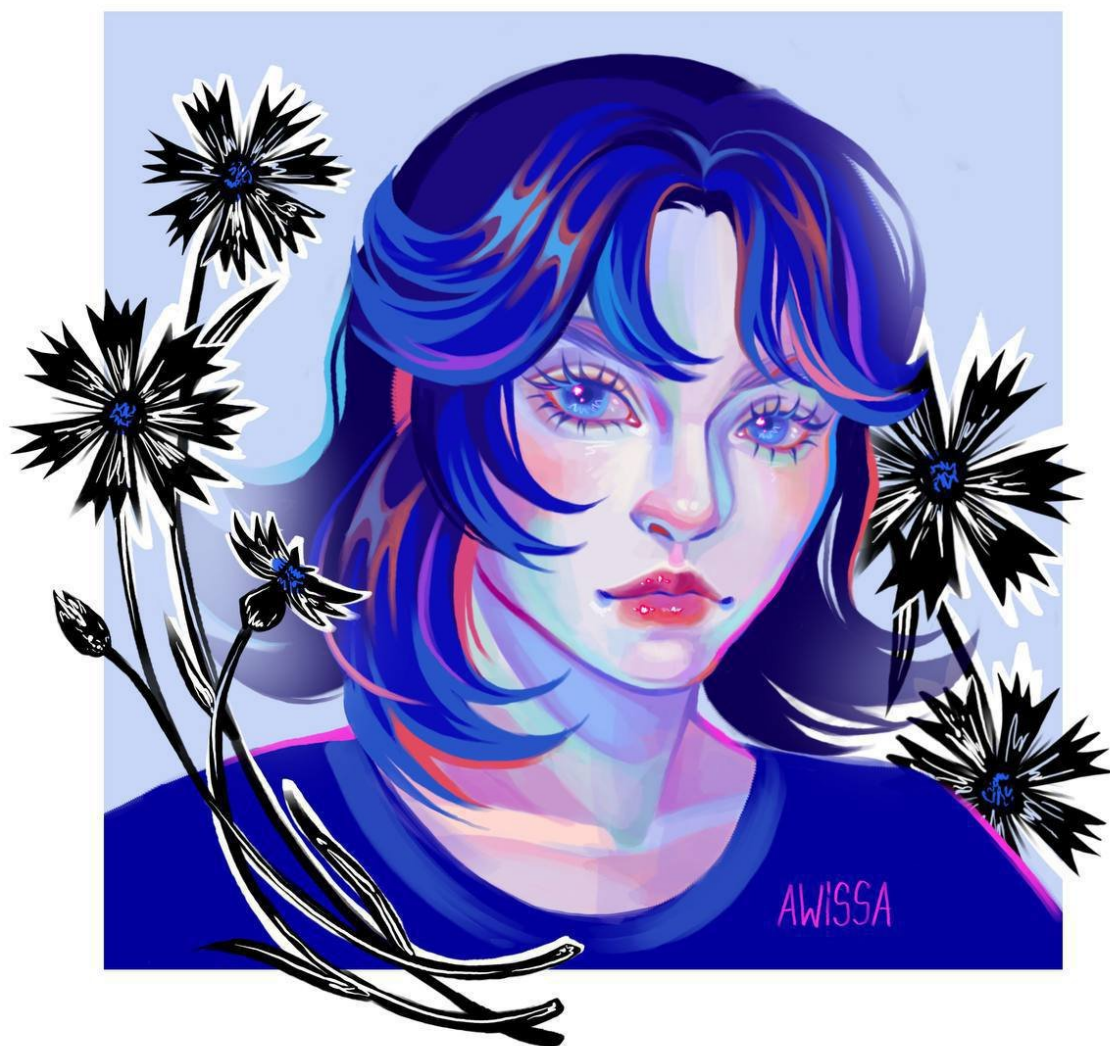
Рис. Б2. Пошуковий варіант графічних квітів