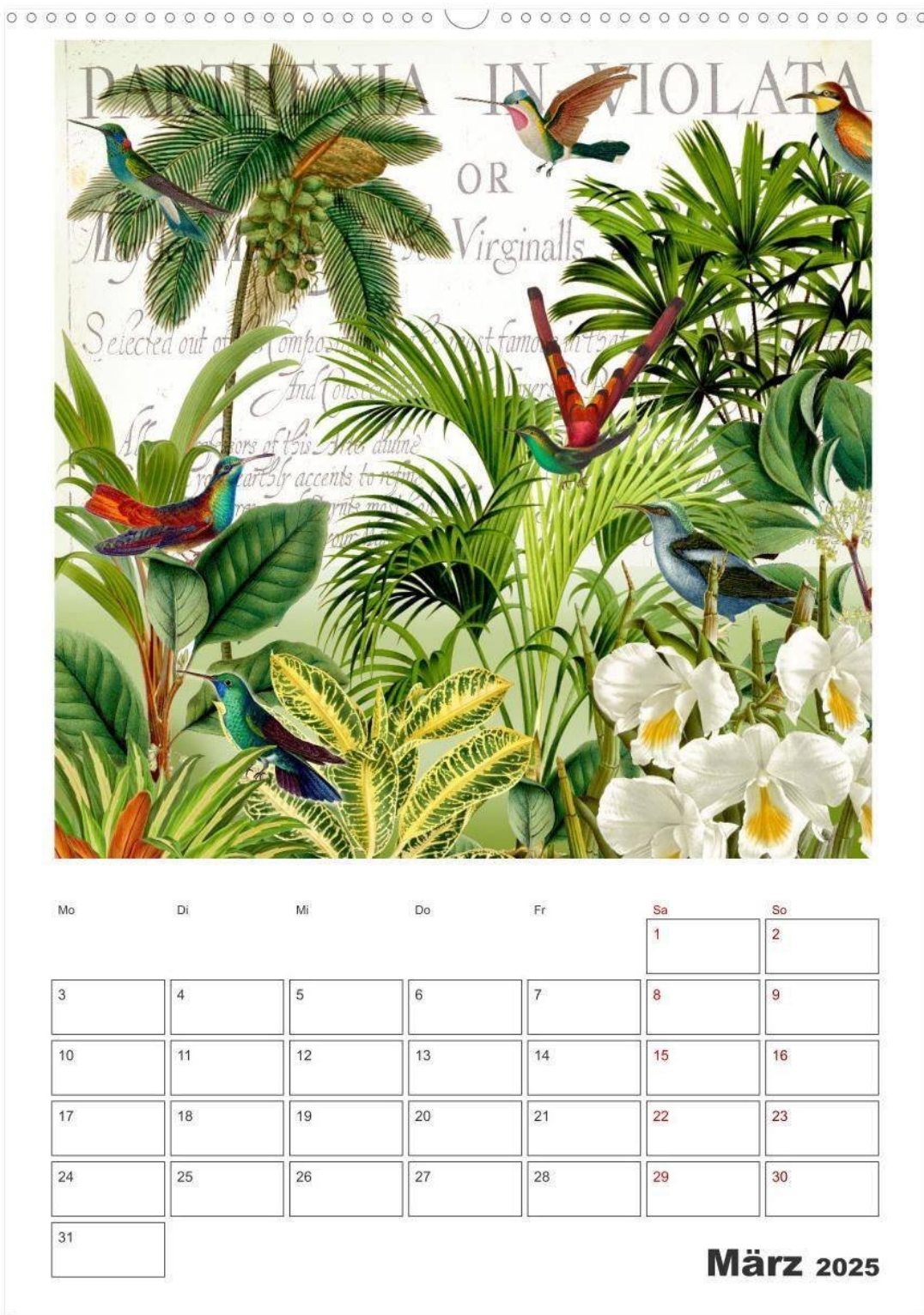
Рис. А5. П'ятий аналог, автор дизайну невідомий