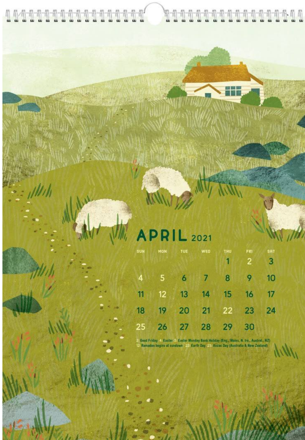
Рис. А1. Перший аналог, автор дизайну не відомий.