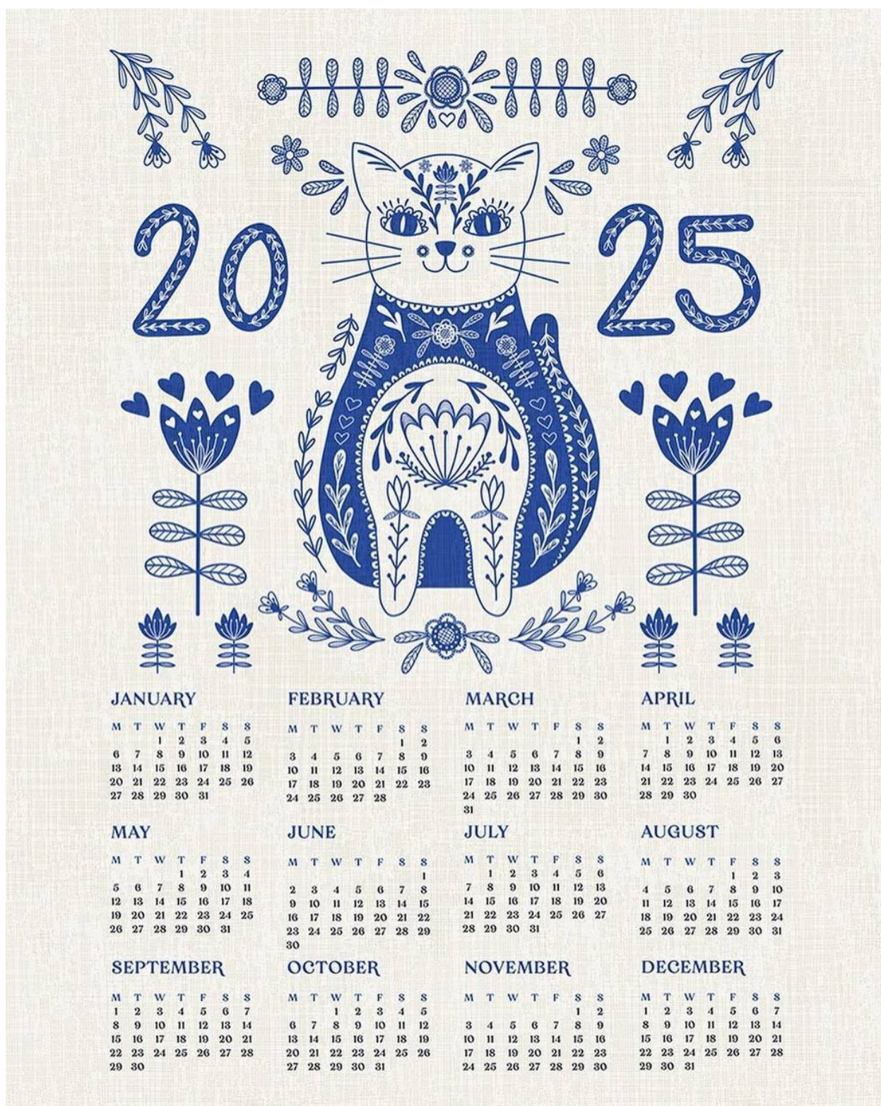
Рис. А6. Шостий аналог, автор дизайну Alexandra Weise