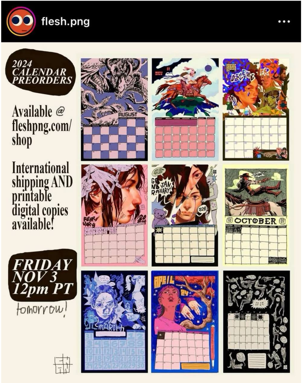
Рис. А3. Третій аналог, автор роботи Flesh Png