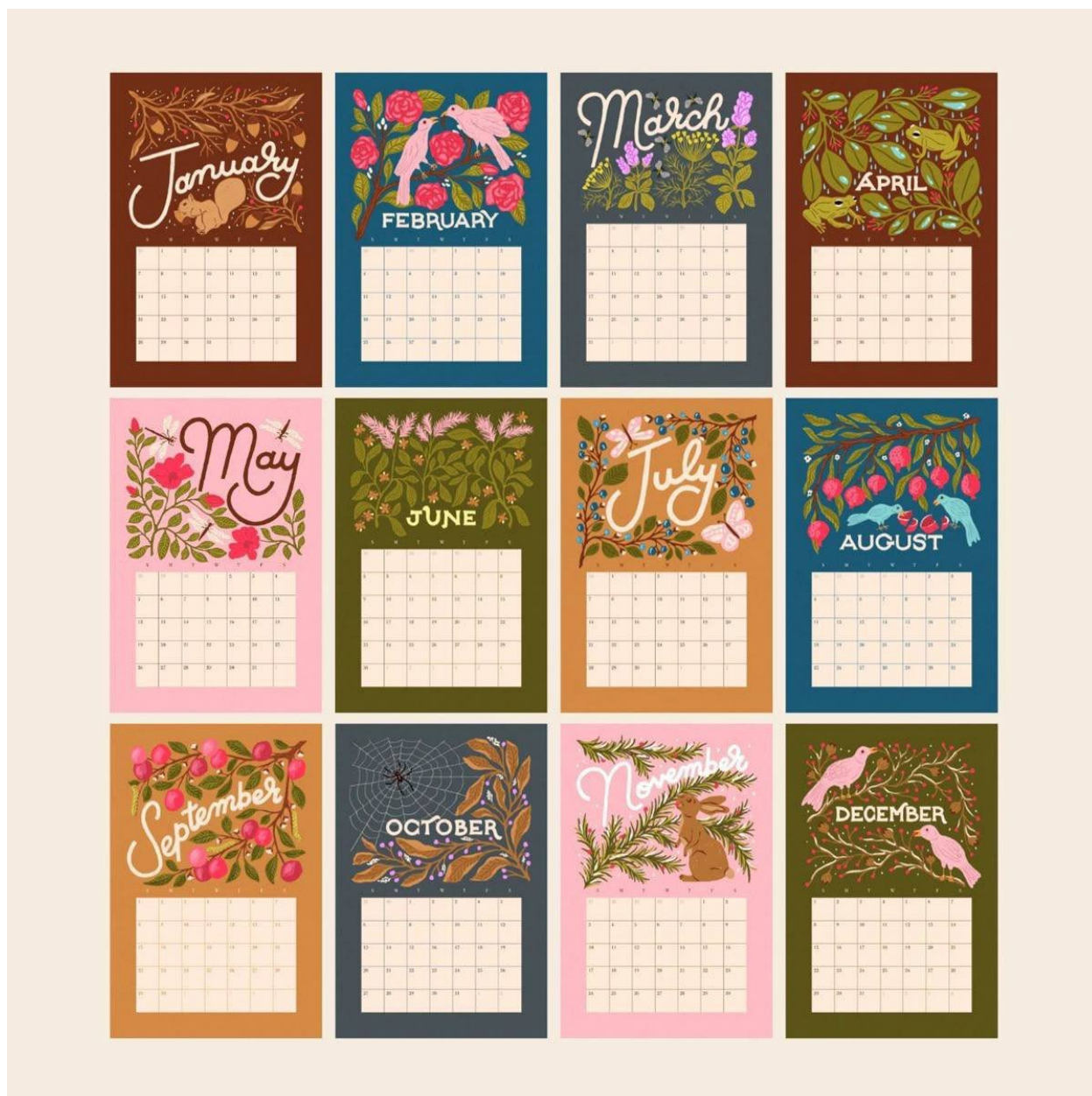
Рис. А9. Дев'ятий календар, автор дизайну Cassidy