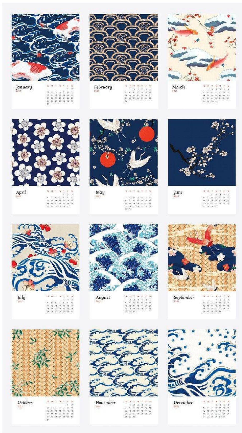
Рис. А10. Десятый календар, автор дизайну Watanabe Seitel