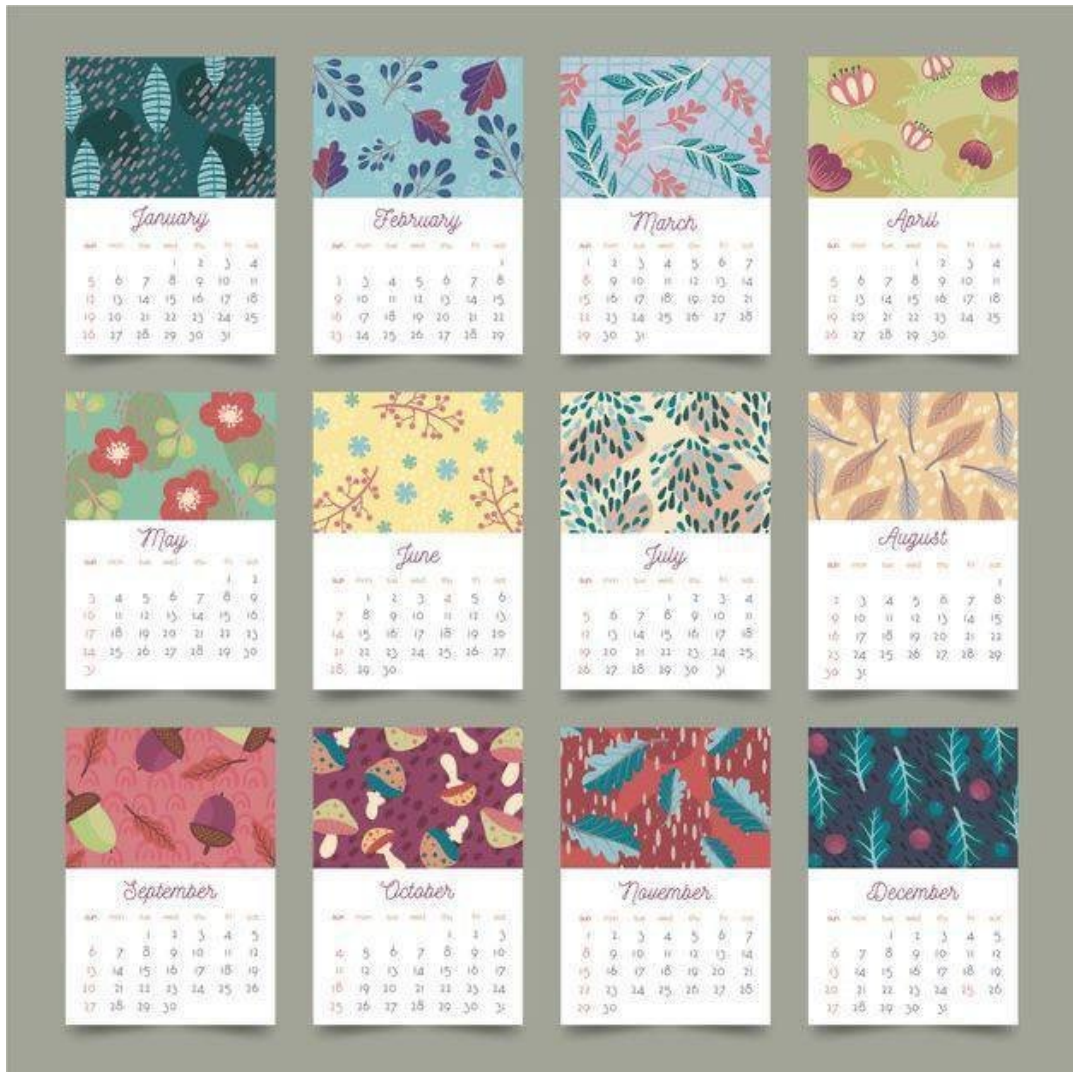
Рис. А8. Восьмий календар, автор дизайну невідомий