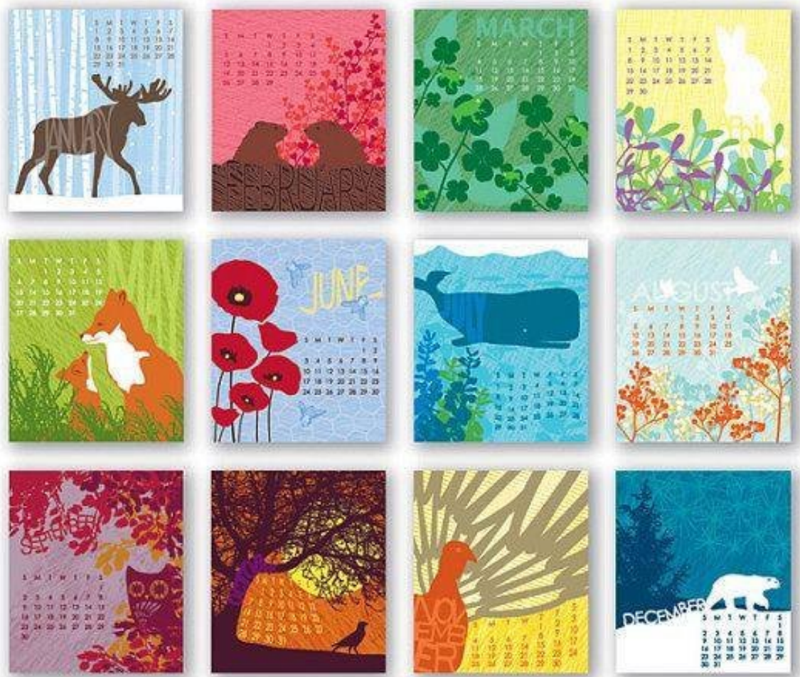
Рис. А7. Сьомий аналог, автор дизайну невідомий