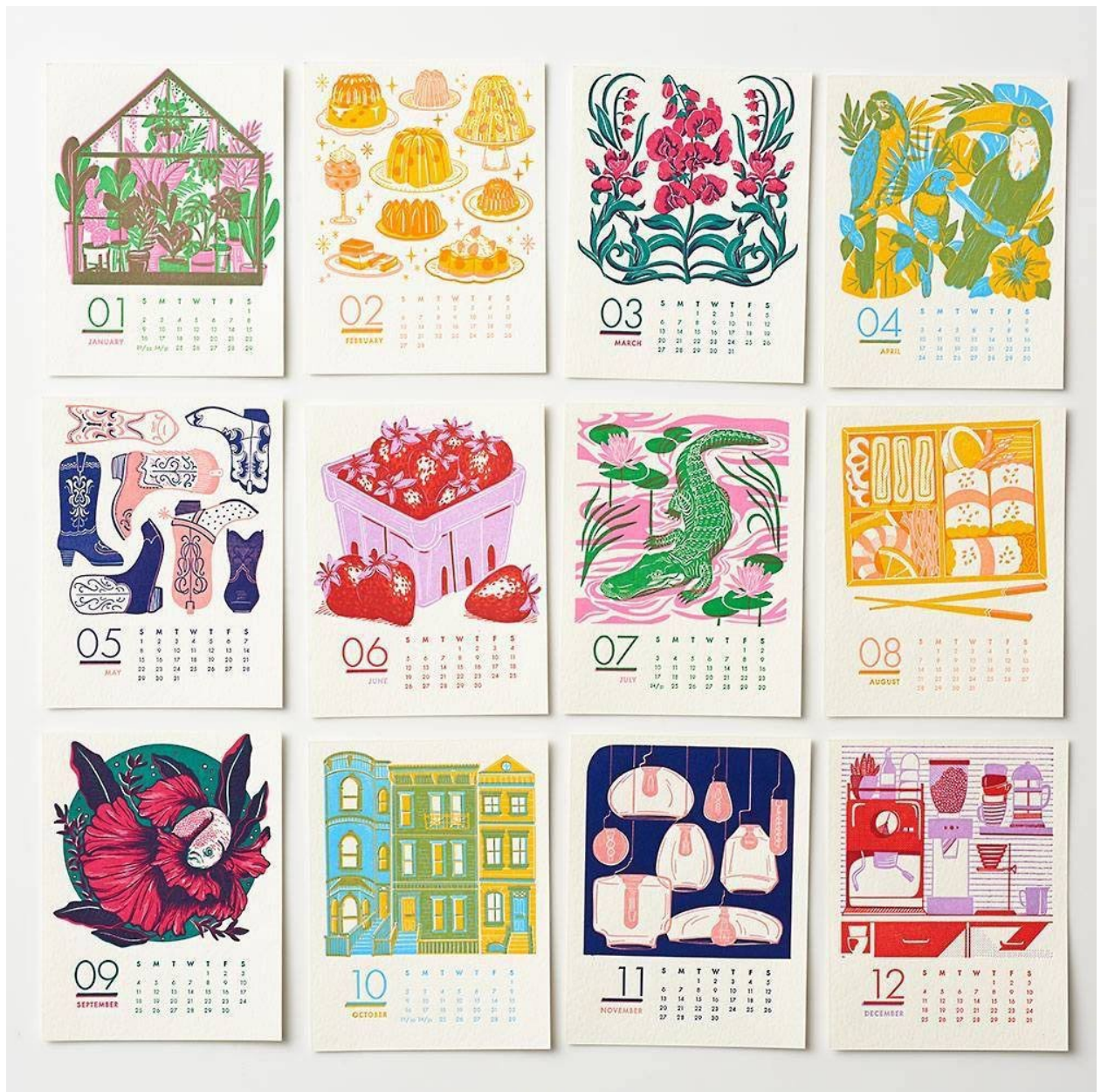
Рис. А4. Четвертый аналог, автор дизайну невідомий