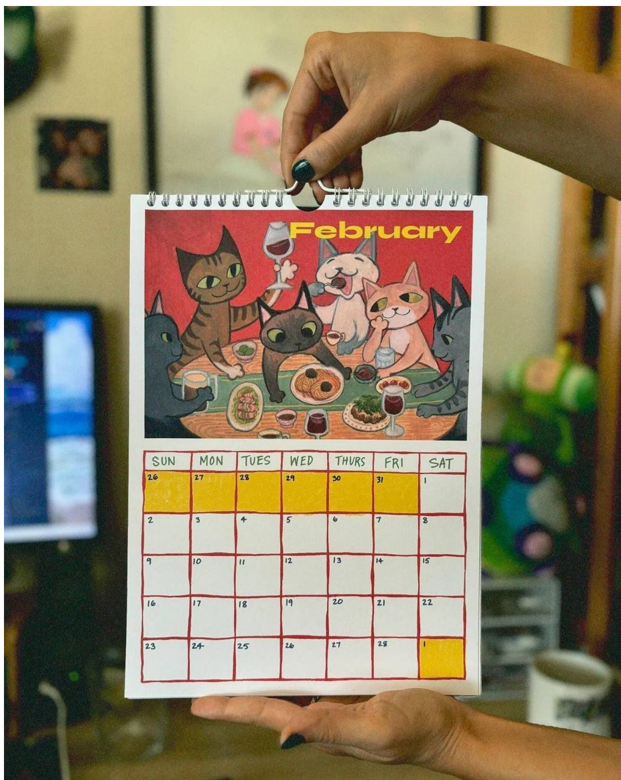
Рис. А2. Другой аналог, автор дизайну Kelly Pringle