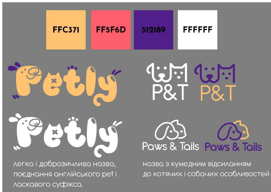
Рис. А. 2. «Перші запропоновані ескізи»