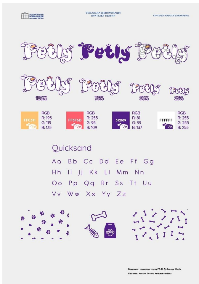
Рис. А. 3. «Затверджений варіант»