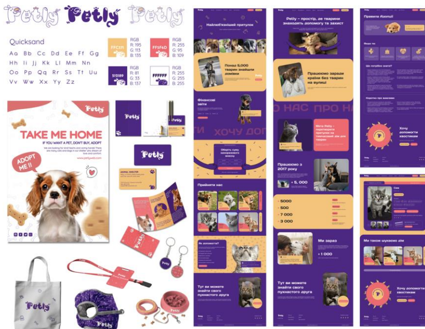
Рис. Б. 1. «Візуальна частина проєкту»